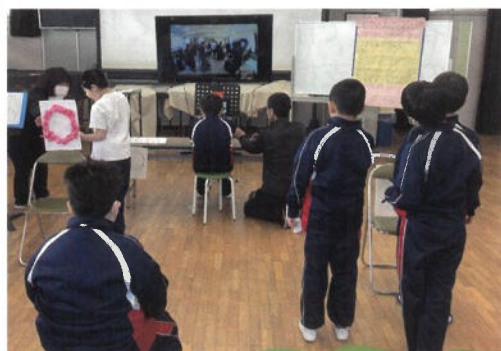
小学部（飯富小学校との交流）