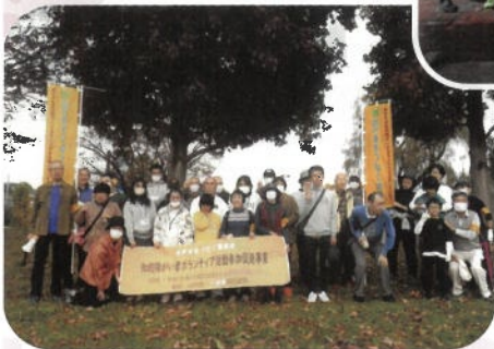
水戸手をつなぐ育成会