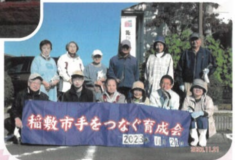
稲敷市手をつなぐ育成会