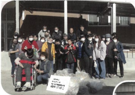
かすみがうら市 手をつなぐ育成会