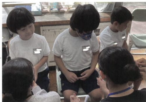
小学部（茨城大学との交流）

高等部1年生は、地域交流の一環として、飯富市民センターの清掃活動を行いました。社会の一員として地域に貢献するとともに、将来の職業生活に繋がる貴重な経験の場となっています。