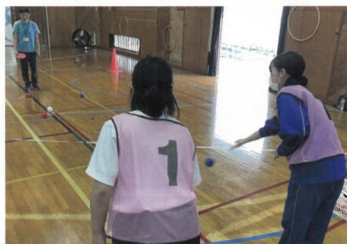
中学部（国田義務教育学校との交流）