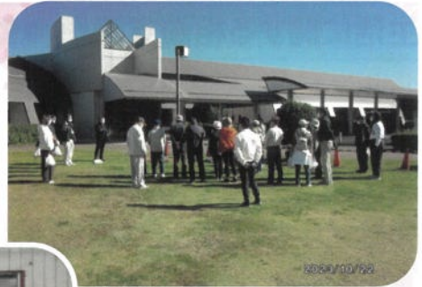
石岡市 手をつなぐ育成会野ばらの会