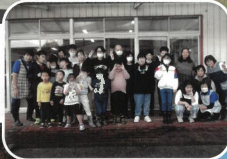
境町 心身障害児者父母の会